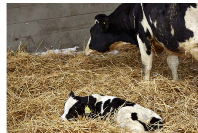
Intern smittebeskyttelse for kælvende. Her er fx vist adskillelse fra påvirkning fra andre dyr i særskilt kælvningsboks.