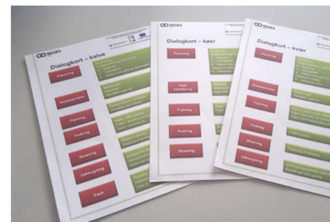
Overskrifterne på dialogkortene er placering, holdstørrelse, flytninger, fodring, strøning, udmugning, vask med mere.